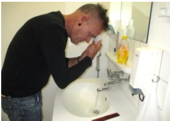
Die Elektroden und die Gummikappe werden entfernt. Sie dürfen sich nun Ihre Haare richten .