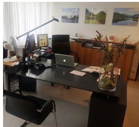
Zum Abschluss folgt die Konsultation bei Ihrer Ärztin oder Ihrem Arzt .