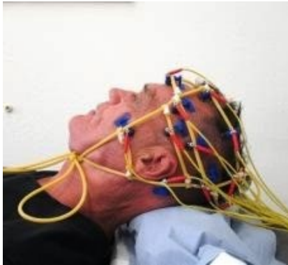
EEG-Ableitung in Ruhe